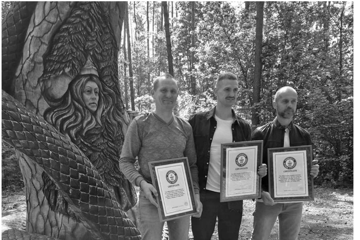
Į Gineso rekordų knygą įrašyta skulptūra „Eglė žalčių karalienė“ neabejotinai taps dar vienu Anykščių traukos objektu.

Lietuviams iš viso priklausos per 60 Gineso rekordų. Į šią knygą vien galiūnas Žydrūnas Savickas yra įrašytas keliolika kartų.