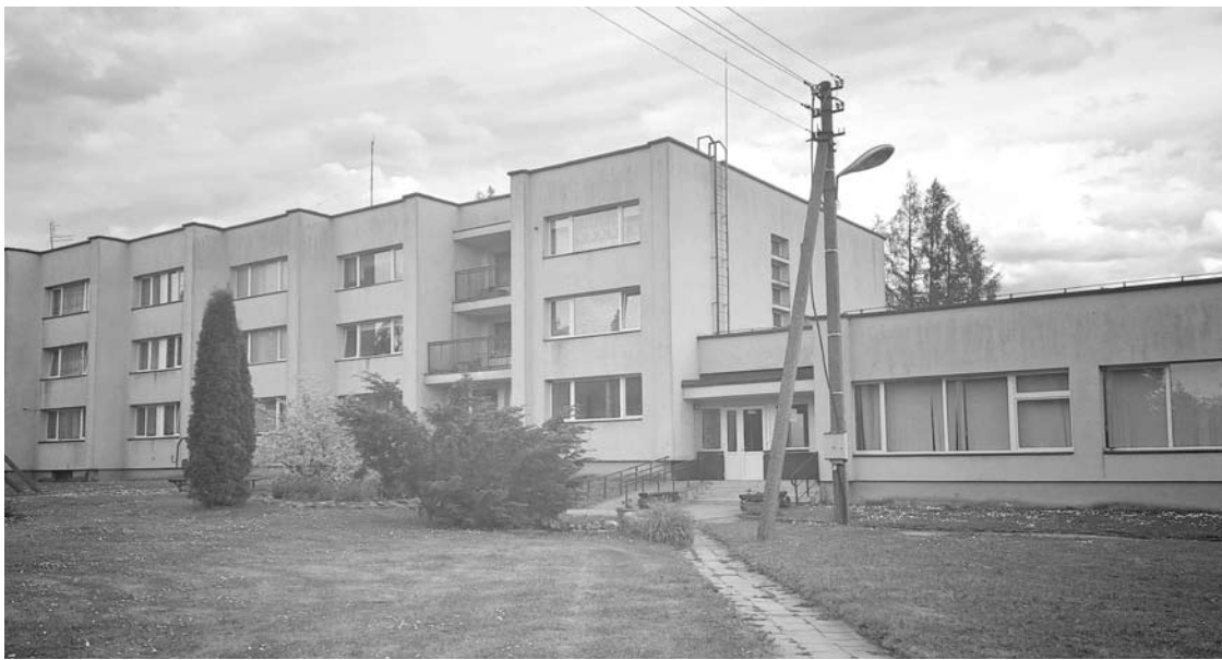
Šių Anykščių rajono šeimos ir vaiko gerovės centro pastatų rekonstrukcija ir remontas Auleliuose šiandien kainuotų virš 11 mln. Eur.

Šiam projektui jau išleista 101 tūkst. Eur, iš kurių 9 tūkst. – iš savivaldybės biudžeto. Jei Anykščių rajono taryba nuspręs projekto Auleliuose nebetęsti, išleistas lėšas teks grąžinti valstybei.