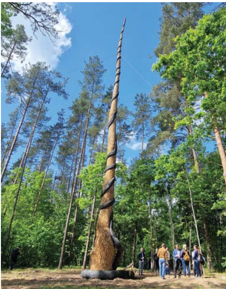
Skulptūros rekordininkės aukštis – 25 metrai ir 11 cm.

Vidmantas ŠMIGELSKAS vidmantas.s@anyksta.lt