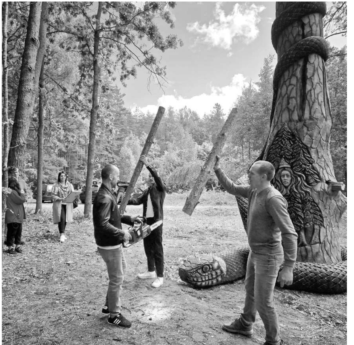
Šventinėse iškilmėse perpjautas rąstelis, pakeitęs atidarymo progos simbolinę juostelę.