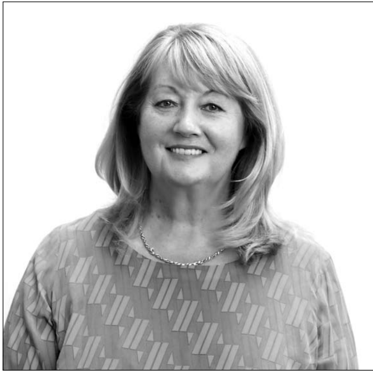
Vilija Blinkevičiūtė: „Jei žmonės skurs, didės atskirtis, planuoti ir kurti sėkmingą Europos ir Lietuvos ateitį bus sudėtinga.“

pos Komisijos paskelbtą analizę, vertinimus dėl situacijos Lietuvoje?