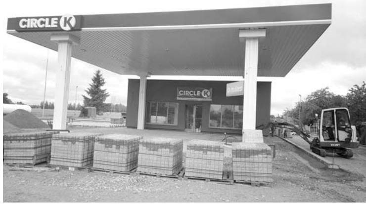
Kavarsko „Circle K“ bus antroji UBA „Narjanta“ degalinė Anykščių rajone.

1996 metais įkurta UAB „Narjanta“ verčiasi ir didmenine